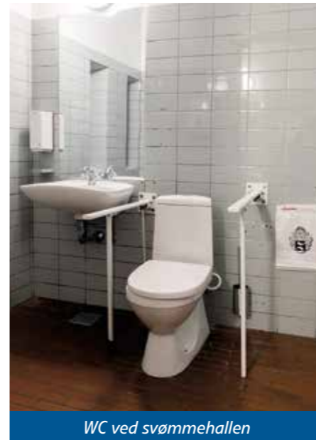
WC ved svømmehallen

Hvis man har lyst til at vide mere om muligheden for at blive elev på Silkeborg Højskole, er man altid velkommen til at kontakte skolen på info@silkeborghojskole.dk eller besøge hjemmesiden www.silkeborghojskole.dk