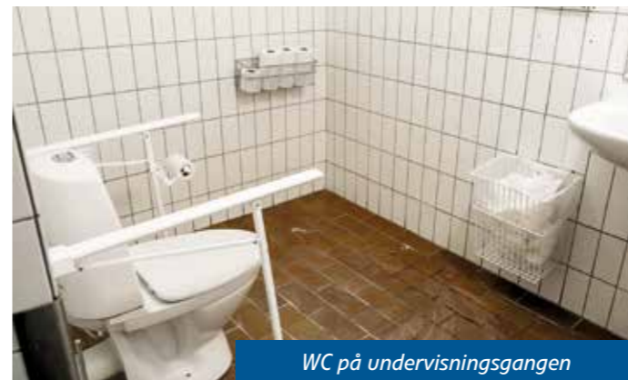
WC på undervisningsgangen